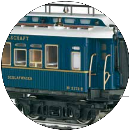
Buitengewoon fijn gedetailleerd en uitgewerkt