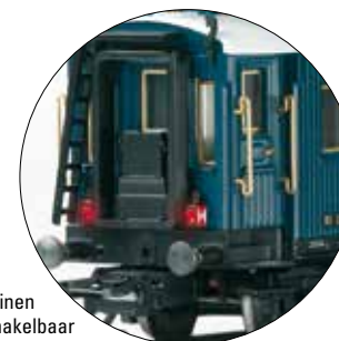
De rode sluitseinen zijn digitaal schakelbaar