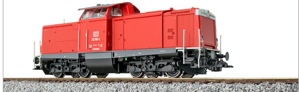
31575 , Diesellok, H0, 212 100 DB, verkehrsrot, Ep. V, Vorbildzustand um 2000, LokSound, Rauch, Kupplung, DC/AC