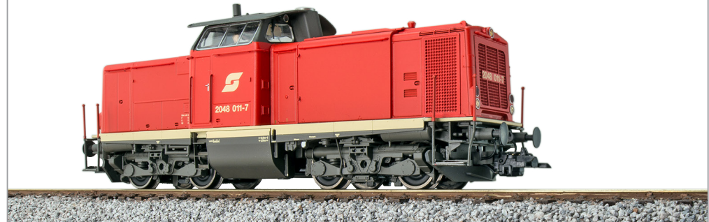
31574 , Diesellok, H0, 2048 011 ÖBB, rot, Ep. V, Vorbildzustand um 1992, LokSound, Rauch, Kupplung, DC/AC