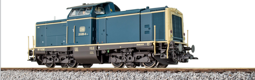
31571 , Diesellok, H0, 211 055 DB, ozeanblau-beige, Ep. IV, Vorbildzustand um 1980, LokSound, Rauch, Kupplung, DC/AC