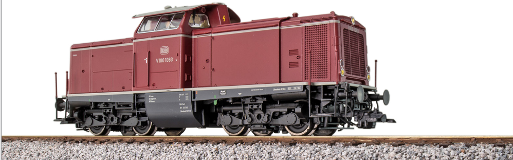
31570 , Diesellok, H0, V100 1063 DB, altrot, Ep. III, Vorbildzustand um 1966, LokSound, Rauch, Kupplung, DC/AC