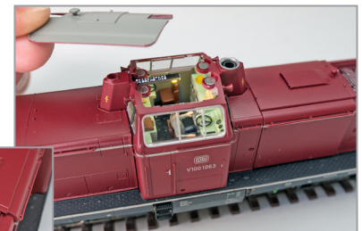
Abnehmbares magnetisch fixiertes Dach