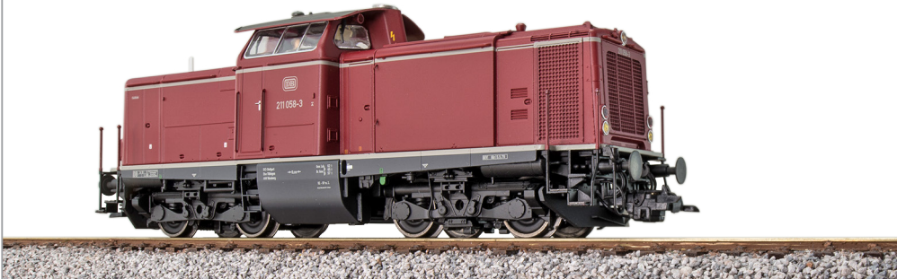
31572 , Diesellok, H0, 211 058 DB, altrot, Ep. IV, Vorbildzustand um 1982, LokSound, Rauch, Kupplung, DC/AC